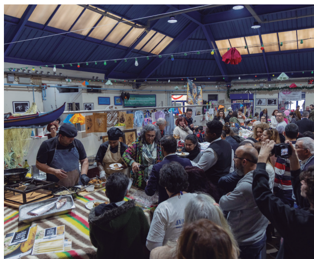
Abrimos o apetite com vários showcookings

Assente na tradição gastronómica das comunidades que se fixaram nas zonas ribeirinhas, o destaque ao sável dá continuidade à valorização destas raízes, cimentando e potenciando a ligação do Município ao Tejo. ©