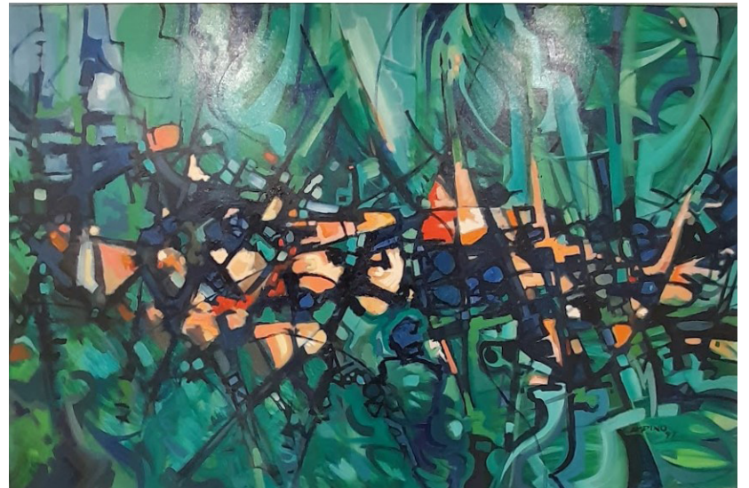
Delírio da Cor